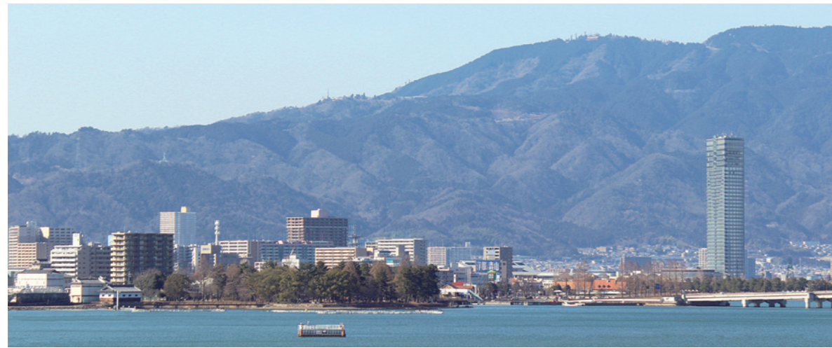
夕照たまのうらから望む琵琶湖の風景。夕映えと山々と、時には花火を「楽しむ」。

特別養護老人ホーム せきしょう 夕照たまのうら 〒520-2142 滋賀県大津市玉野浦15番1号 Fax.077-548-1033 E-mail sekisyotamanoura@kiriyuen.or.jp