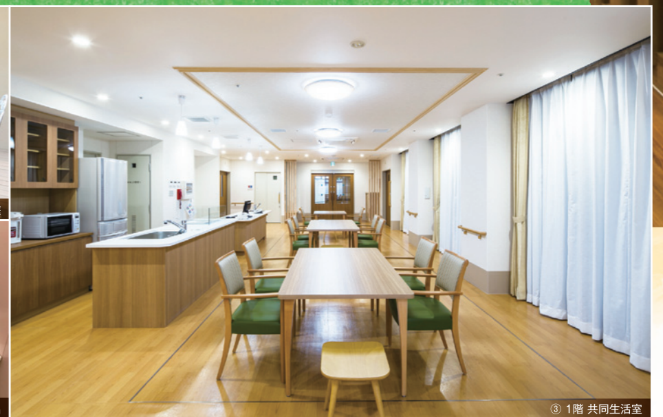
③ 1階 共同生活室