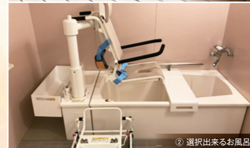
② 選択出来るお風呂