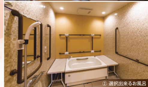
② 選択出来るお風呂