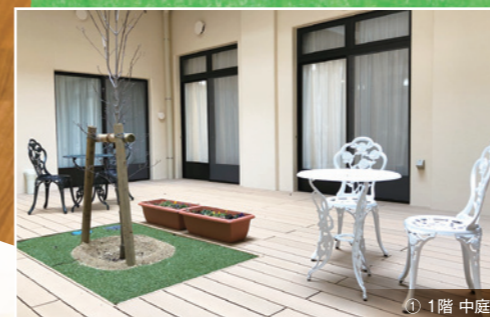
① 1階 中庭